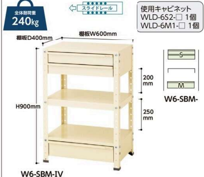
W6-SBM-IV W6-SBM- 質量:30.4kg ¥100,940

※ご注文の際、品番後ろの にカラー記号を当てはめてください。棚板1段(補強なし)追加価格 WS6T-SET- (3.2kg) ¥9,400