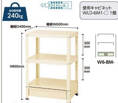
W6-BM-IV W6-BM- 質量:20.2kg ¥62,940