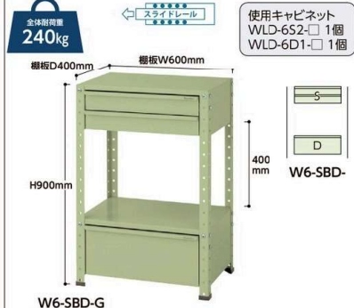
W6-SBD-G W6-SBD- 質量:30.2kg ¥94,840