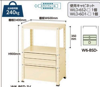
W6-BSD-IV W6-BSD- 質量:33.4kg ¥104,240