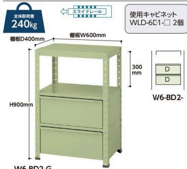
W6-BD2-G W6-BD2- 質量:32.4kg ¥91,640