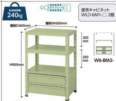
W6-BM2-G W6-BM2- 質量:29.6kg ¥94,440