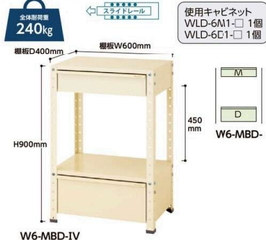
W6-MBD-IV W6-MBD- 質量:26.2kg ¥78,940