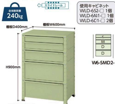
W6-SMD2-G W6-SMD2- 質量:52.0kg ¥161,140