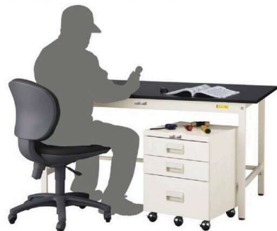
キャビネットワゴン使用例