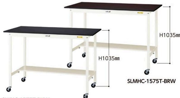
SLKHC-1575T-BKW 75φ自在ストッパー付ゴムキャスター 4個