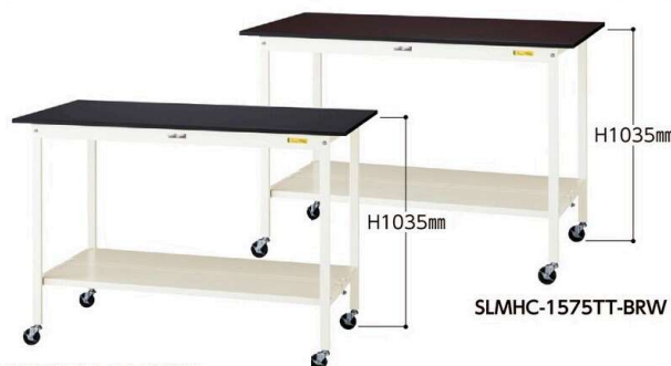
SLKHC-1575TT-BKW 75φ自在ストッパー付ゴムキャスター 4個