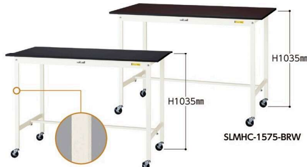
SLKHC-1575-BKW 75φ自在ストッパー付ゴムキャスター 4個

このページの商品の脚には、スリット穴がありません。中間棚の取付はできませんので予めご了承ください。