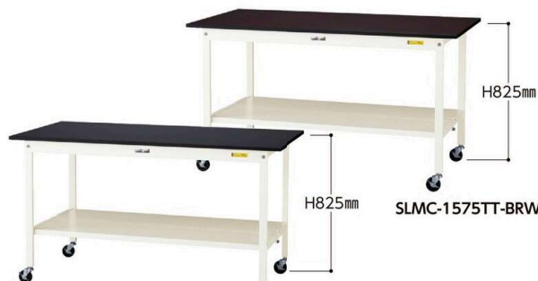
SLKC-1575TT-BKW 75φ自在ストッパー付ゴムキャスター 4個