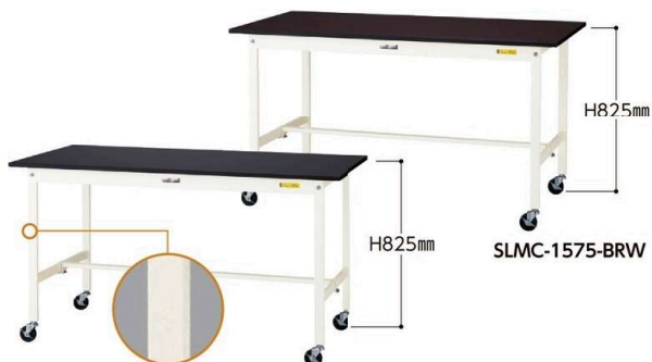
SLKC-1575-BKW 75φ自在ストッパー付ゴムキャスター 4個

このページの商品の脚には、スリット穴がありません。中間棚の取付はできませんので予めご了承ください。