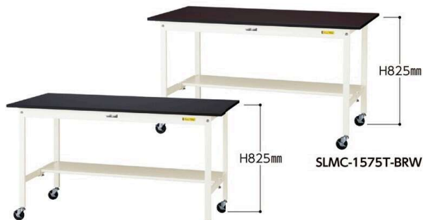
SLKC-1575T-BKW 75φ自在ストッパー付ゴムキャスター 4個