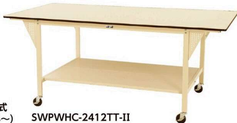
移動式 (P154~) SWPWHC-2412TT-II

奥行1200mmは両面作業に最適です。中央にワークテーブル架台 (P210参照) をセットすることでさらに使いやすくなります。