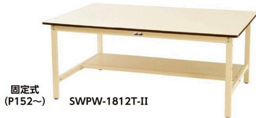
固定式 (P152~) SWPW-1812T-II