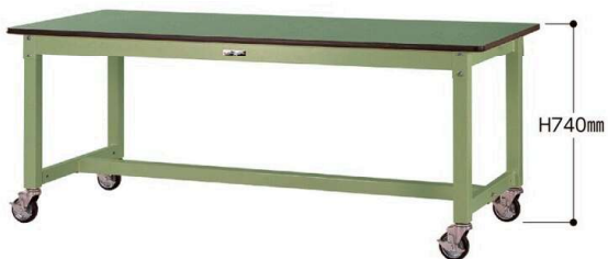
SVRC-1875-GG 100φ自在ストッパー付ゴムキャスター 4個