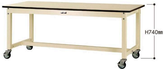
SVMC-1875-II 100φ自在ストッパー付ゴムキャスター 4個