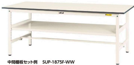
中間棚板セット例 SUP-1875F-WW