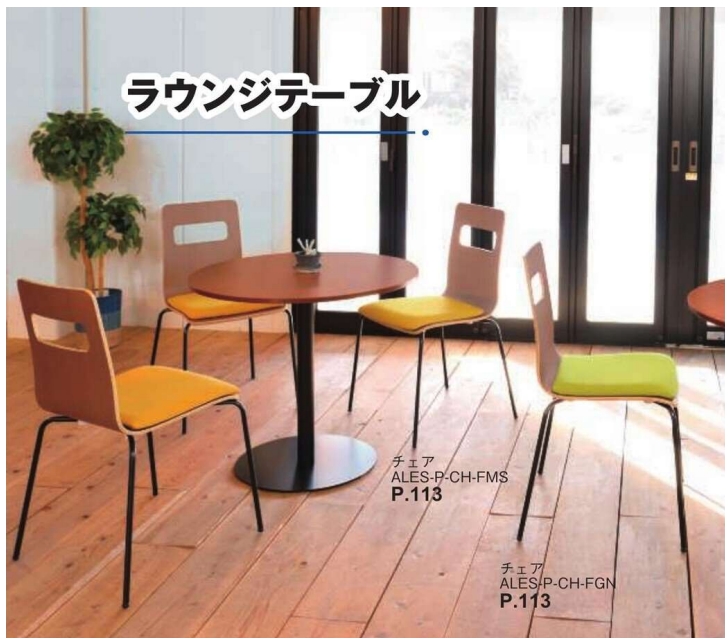
チェア ALES-P-CH-FMS P.113