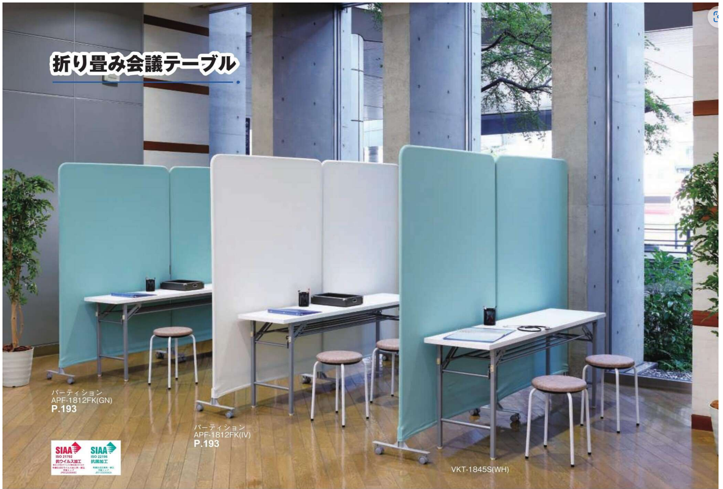
パーティション APF-1812FK(GN) P.193