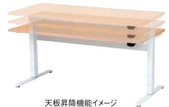
天板昇降機能イメージ

仕様 / 天板: 抗ウイルスメラミン化粧板 フラッシュ加工 抗ウイルスABSエッジ 天板裏: 抗ウイルスパッカー フレーム: スチール 粉体塗装 (ホワイト) 入数: 1 (2個口) ●ガスシリンダー式天板昇降機能付