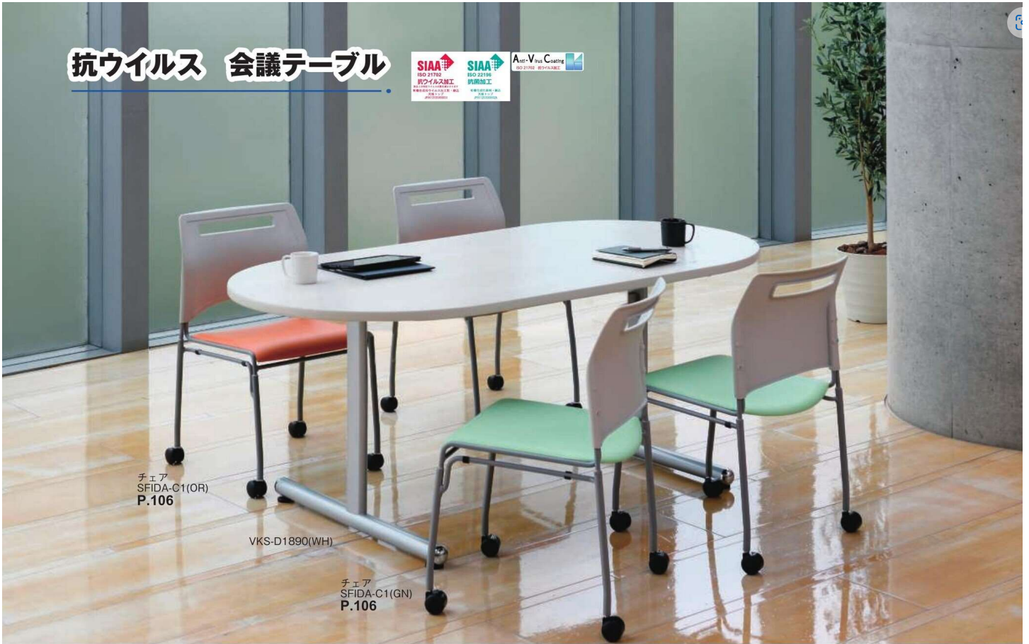
チェア SFIDA-C1(OR) P.106