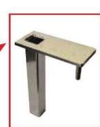
エンドストッパー単体