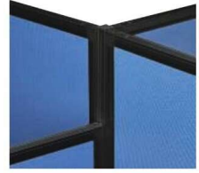
高さ違い連結 (PSB-JK18 × 1PSB-MJ × 4)