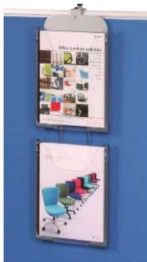
PCP-102(GR) (パンフレットケース)