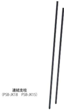
連結支柱 (PSB-JK18 PSB-JK15)