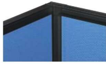
2方向連結 (L字) (PSB-2J × 1)