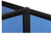
3方向連結 (PSB-JK18PSB-MJ × 3)