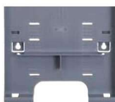
サイズチェンジパーツで A4以下の収納が可能です。