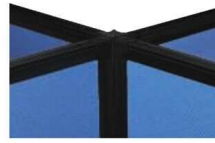
4方向連結 (PSB-JK18 × 1PSB-MJ × 4)