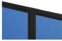
2方向連結 (直線) (PSB-2J × 1)