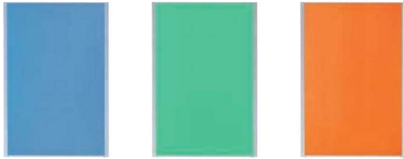
MP-1812AB(ブルー) MP-1812AB(グリーン) MP-1812AB(オレンジ)