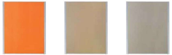
MP-1512AB(オレンジ) MP-1512AB(ベージュ) MP-1512AB(グレー)