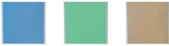
MP-1212AB(ブルー) MP-1212AB(グリーン) MP-1212AB(ベージュ)