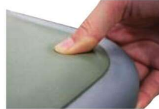
ポリウレタン樹脂製のやさらかいクッションパット付き。