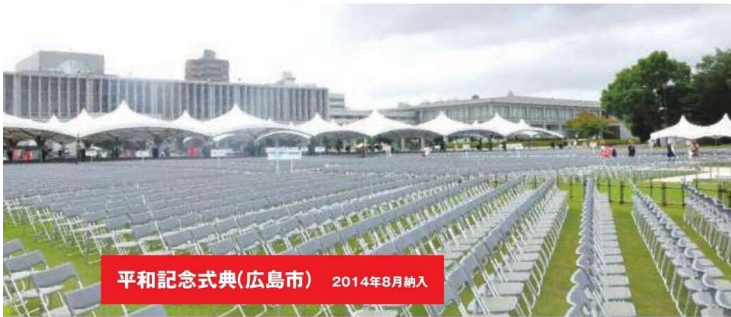
平和記念式典(広島市) 2014年8月納入