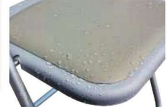
クッションパットは2重成型によって内部に水が浸入しません。