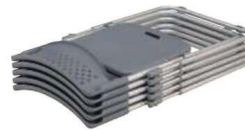
スタッキング例 すっきりと収納できてスペースをとりません。