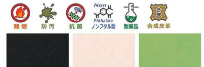
BK: ブラック 座