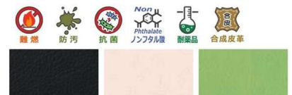
BK: ブラック 座