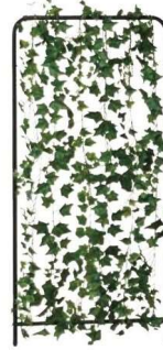
グリーン付き増設フレーム

サイズ: W1400×D22.2×H1500mm 本体: スチール 粉体塗装 入数: 1(2個口) 梱包寸数: 1.2才 梱包重量: 9.4kg ●連結可能 ●アジャスター付