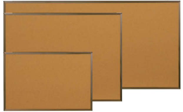
ワンウェイ掲示板カラーアルミ枠 (天然コルク)