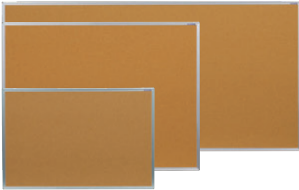
ワンウェイ掲示板 (天然コルク)