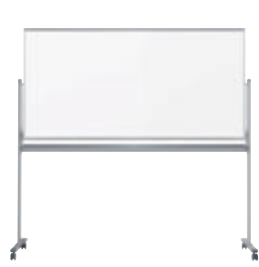
UM36TD ¥127,900 外形寸法 / W1926×D610×H1840 板面寸法 / W1810×H910 有効寸法 / W1770×H870