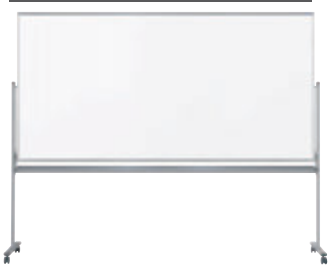
UM48T ¥162,500 外形寸法 / W2526×D610×H1990 板面寸法 / W2410×H1210 有効寸法 / W2370×H1170