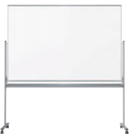
UM46TD ¥156,200 外形寸法 / W1926×D610×H1990 板面寸法 / W1810×H1210 有効寸法 / W1770×H1170