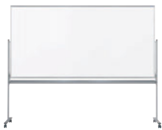
UM48TD ¥205,100 外形寸法 / W2526×D610×H1990 板面寸法 / W2410×H1210 有効寸法 / W2370×H1170