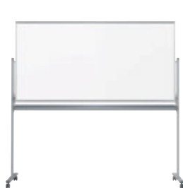
UM36T ¥102,700 外形寸法 / W1926×D610×H1840 板面寸法 / W1810×H910 有効寸法 / W1770×H870