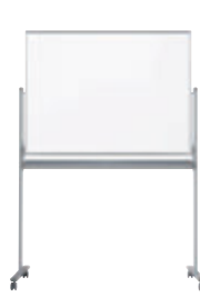
UM34TD ¥103,800 外形寸法 / W1326×D610×H1840 板面寸法 / W1210×H910 有効寸法 / W1170×H870