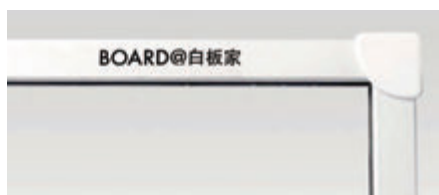
S : シルバー (JM-900、JM-1500 のみ)