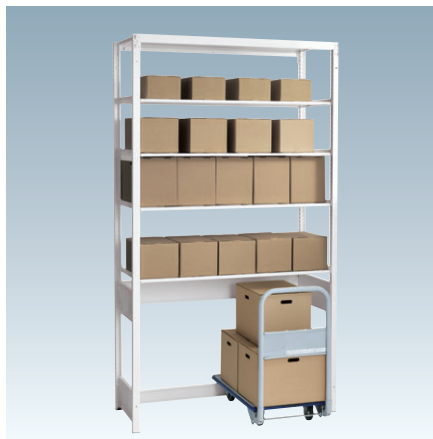
※抗菌剤は含まれていません。