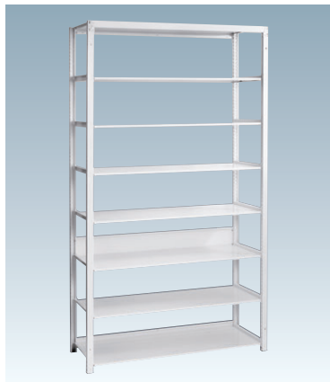
※抗菌剤は含まれていません。