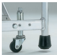
移動に便利なスプリングキャスター(φ40)付