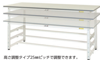
高さ調整タイプ25mmピッチで調整できます。