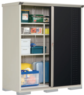
GP-177AT NK(ナイトブラック)-[5] NEW