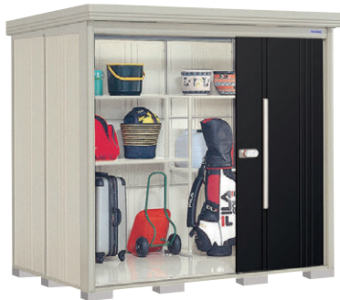
ND-2215 N(ナイトブラック)-[4] NEW