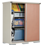
TR(トロピカルオレンジ)-[3]