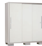
TW(ティントホワイト)-[1]