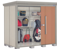
T(トロピカルオレンジ)-[3]