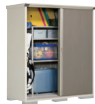
CB(カーボンブラウン)-[2]