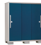
DO(ディープオーシャンブルー)-[3]