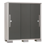
GM(グラファイトメタリック)-[2]