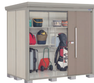
B(カーボンブラウン)-[1]