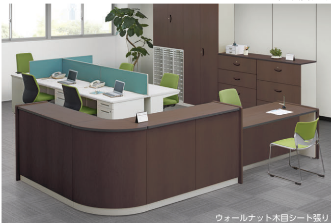
ウォールナット木目シート張り