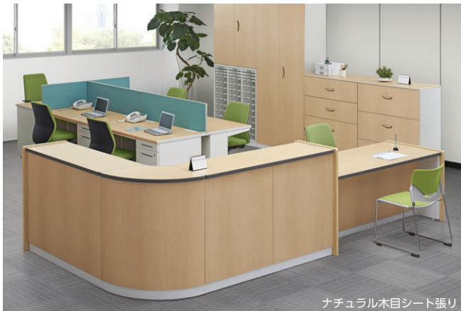
ナチュラル木目シート張り