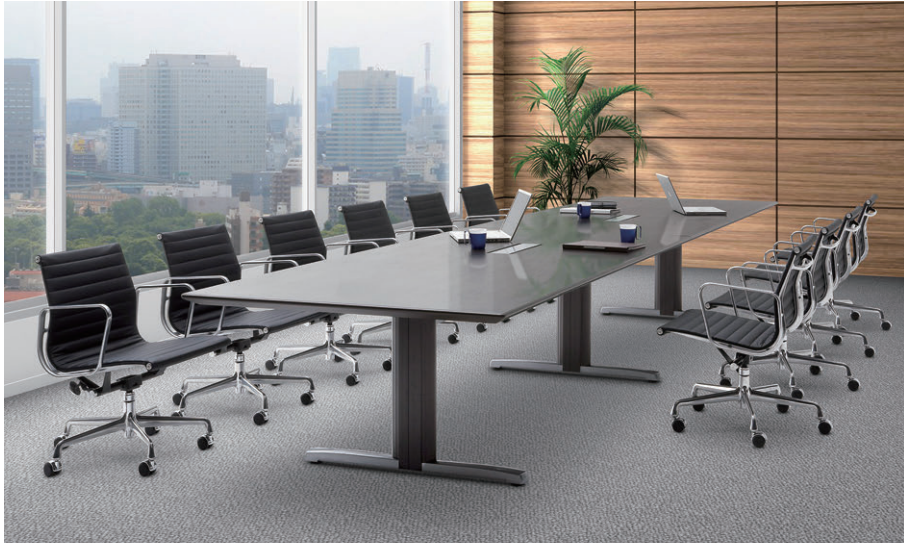
セット写真のテーブル ATN-4812W-D (ダークブラウン)、チェア TEA335VDLL2109 チェア H198