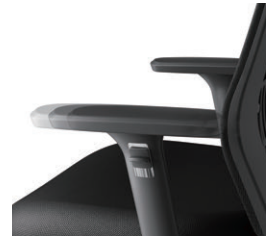
肘前後調節 5mmピッチ、13段階