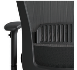
ランバーサポート機構 8mmピッチ、7段階