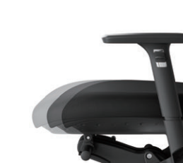
座前後調節 11mmピッチ、7段階