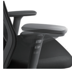
肘角度調節 ±30° 肘高さ調節 11mmピッチ、10段階