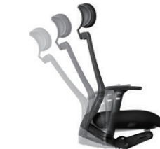
シンクロロック機構