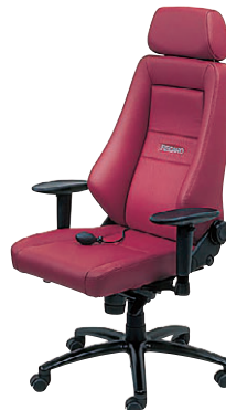
LW(レザーワインレッド818)-4