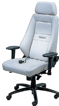
LG(レザーライトグレイ817)-2