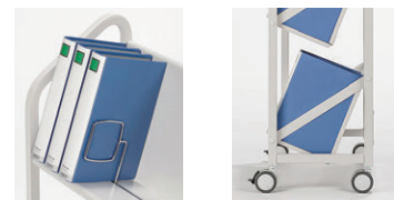
ファイルサポート付

W882×D360×H1290 ●ファイルサポート6本付 有効内寸/W811×D225×下段・中段H360