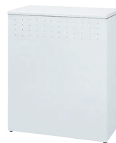
(インフォメーション)