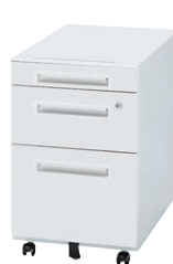
⑤ WGN-603WW (シリンダー錠)