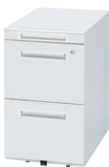
② WGN-653NWW (ダイヤル錠)