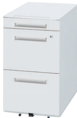
① WGN-683WW (シリンダー錠)