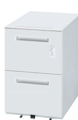
③ WGN-D602WW (ダイヤル錠)