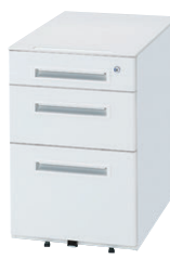
④ WGN-L603WW (シリンダー錠)