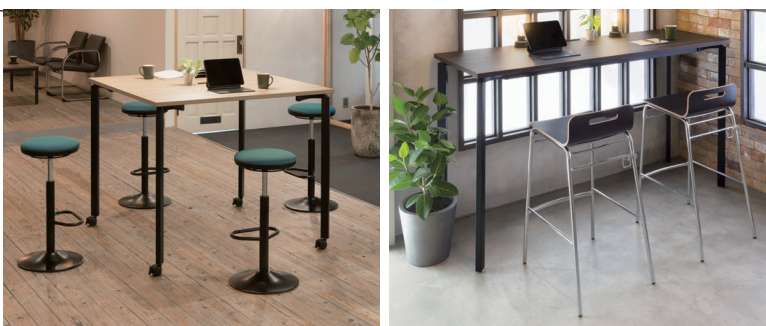
テーブル：OYTN-C1212HTC-LCK チェア P325 テーブル：OYTN-C1860HTA-DCK チェア P376