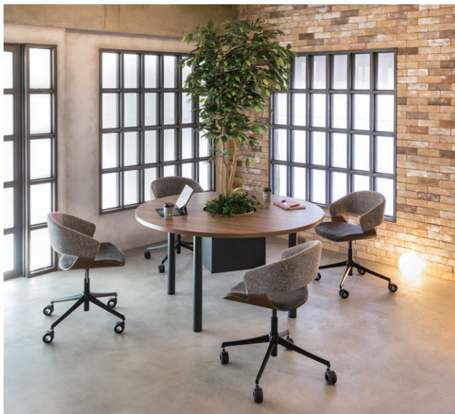
写真のチェア MCK-214CLCKF-LGG 写真のオフィスグリーン 508F500