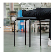
再生樹脂使用のチェア

使用済み自動車の破砕時、有用金属などを回収した後の残渣(ざんざ)はASRと呼ばれます。スタッキングチェアの座、及び背面にはASRを再生樹脂素材として使用しています。