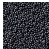
PP再生樹脂ペレット