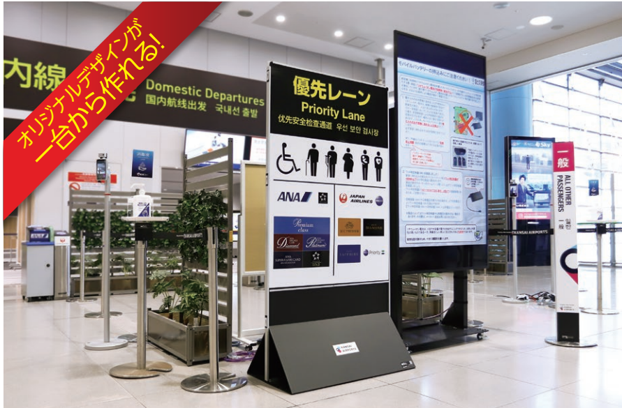
ミセル 直立サイン(差替え式)900×1800 + ミセル ホルダーメディカル + ミセル ハイグレードメッセW150×1500 ※別注でお好みのサイズも製作できます。詳しくは弊社又は係員までお気軽にお問い合わせください。