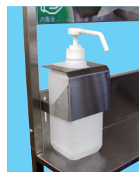
消毒液盗難抑制ホルダー使用例

袋止め付ステンレス製ゴミ箱 使用済み ペーパータオル 収納目安約 200~250枚