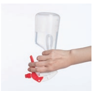
傾けても使えるフレキシブルノズル採用

色コード/0.赤 3.青 ●目盛り付 ●薬液は入っていません。容器のみの販売となります。