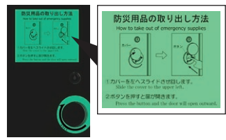
暗闇で光る蓄光サインで取り出し方法を表示します。