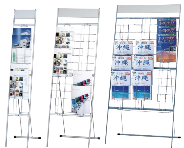
NDP-110 NDP-210 NDP-310 ※写真は使用イメージ