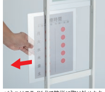
パネルはスライド式で簡単に取り外せます。 (上段:上スライド、下段:横スライド)