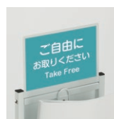
A5サイズのPOPが表示 できる表示面付き。