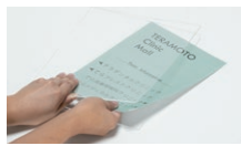
掲示物はパネルに挟んで簡単に セットできます。