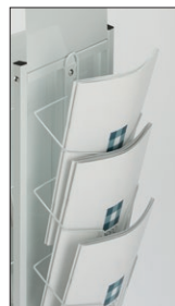
R形状のポケットなので 薄いチラシも前倒れにくい。

ホルダーが湾曲しているので、 パンフレットや薄いチラシも 折れにくいスタンドです。