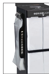
折りたたみ傘用傘袋ホルダー ブラック▶P.135