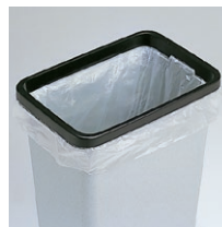
袋止め付ボックス