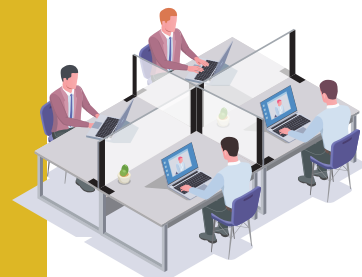
オフィスなど 多人数の飛沫対策に