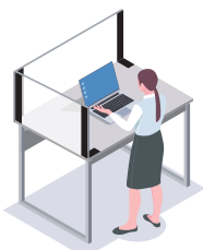
コーナー部などの飛沫対策に