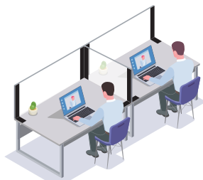
隣り合わせでの飛沫対策に