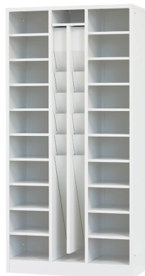
アンブレラ&シューズロッカー