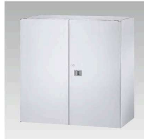
SS-09H ¥230,100 内寸法/W865×D476×H842mm 質量/47.5kg 棚板2枚・鍵・ラッチ付

H900 (上下兼用) 外寸法/W900×D500×H900mm ※下置使用時にはベースが必要です。