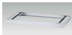
SS-B1 ¥40,100 外寸法/W900×D476×H60mm 質量/5.1kg アジャスター付