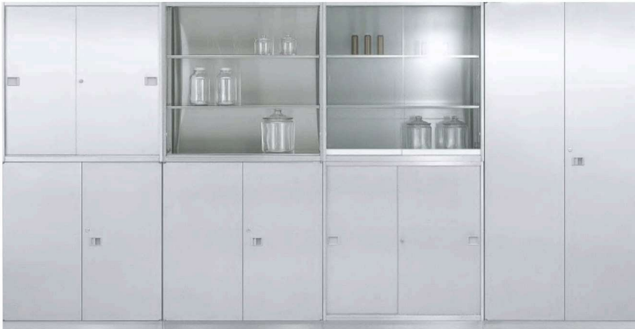
仕様 本体/ステンレスSUS304ヘアライン仕上げ 棚板/ピッチ26mm 耐荷重50kg (均等荷重)