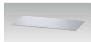
SS-DSB ¥21,800 外寸法/W860.5×D432×H15mm 質量/4.1kg