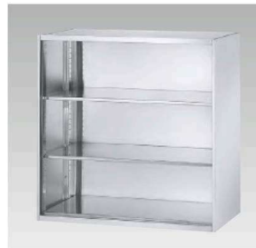
SS-09K ¥169,500 内寸法/W865×D499×H837mm 質量/39.0kg 棚板2枚付

H900 (上下兼用) 外寸法/W900×D500×H900mm ※下置使用時にはベースが必要です。