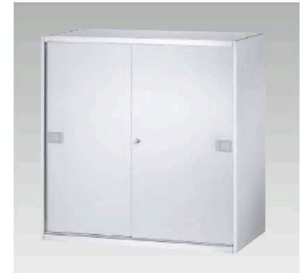
SS-09S ¥211,400 内寸法/W865×D467×H837mm 質量/45.5kg 棚板2枚・鍵付