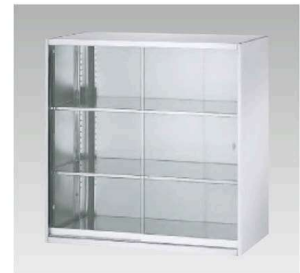
SS-09G ¥230,100 内寸法/W865×D467×H837mm 質量/47.5kg 棚板2枚付 ※強化ガラス使用