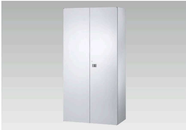
SS-18H ¥410,900 内寸法/W865×D476×H1734mm 質量/81.0kg 棚板4枚・鍵・ラッチ付

H1800 (下置専用) 外寸法/W900×D500×H1800mm ※下置使用時にはベースが必要です。